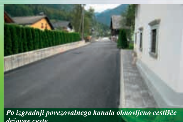
Po izgradnji povezovalnega kanala obnovljeno cestišče državne ceste

Za naš del projekta smo izvajalsko pogodbo podpisali z Gorenjsko gradbeno družbo, d. d. Dela potekajo po zastavljenem terminkem planu. Tako je trenutno v celoti