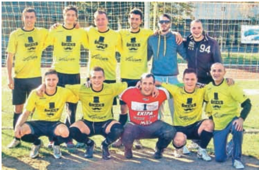
Nogometna sekcija Smola