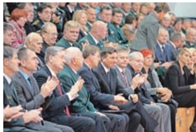
Slovesnosti so se udeležili tudi predsednik države Borut Pahor ter nekdanji predsednik Danilo Türk ter ministrica za notranje zadeve Vesna Györkös Žnidar in obrambni minister Janko Veber.

posebno slovesnost. Obeleževanje odhoda zadnjega vojaka JLA iz Slovenije je v preteklih letih potekalo različno, na različnih krajih in v različnih organizacijah; lani so jo tako pripravili v Cerkljah ob Krki, letos pa v sodelovanju s Pokrajinskim odborom ZVVS Gorenjska in Policijskim veteranskim društvom Sever Gorenjska v Radovljici. Zadnji vojaki JLA so se umikali iz vseh vojaških objektov na območju Republike Slovenije. Čas do dokončnega umika je bil za pripadnike TO in policiste poln negotovosti, napetosti, nevarnosti izbruha novih oboroženih spopadov, pogajanj in ne nazadnje prevzemanja izpraznjenih vojaških objektov v varovanje in upravljanje. Vojaške enote so zapuščale tudi vojaške objekte na območju Gorenjske, česar se so spomnili tudi na tokratni slovesnosti v Radovljici. Kraj letošnjega praznovanja prav zaradi dogodkov v času osamosvajanja torej ni izbran naključno. Slovesnost je spremljal bogat kulturni program, udeležili pa so se je tudi predsednik republike Borut Pahor, njegov predhodnik Danilo Türk, ministrica za notranje zadeve Vesna Györkös Žnidar in obrambni minister Janko Veber.