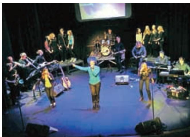
Gift of the Heart je v radovljiški Linhartovi dvorani nastopila v dobrodelne namene.