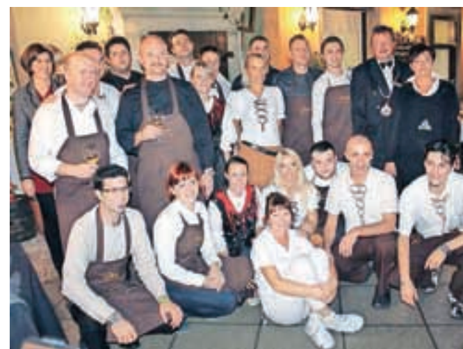
Radol'ški kuharski mojstri in ostala ekipa, ki je organizirala edinstveno večerjo pri Lectarju.