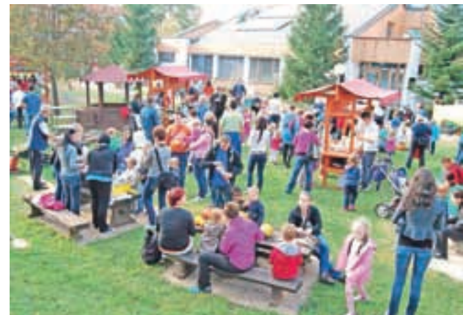
Pod pokroviteljstvom belih čarownic, ki prebivajo v leškem vrtcu od lanskega šolskega leta, se je na jesenskem pikniku zbralo veliko otrok, staršev in drugih obiskovalcev.

blažitev tegob otrok in zaposlenih v jesenskem in zimskem času. Med drugim smo pripravili tudi ognjičevo mazilo, ognjičevo olje, olje arnike, šentjanževo olje, med z dodatkom ameriškega slamnika, smrekov sirup, regratov sirup in še in še,« je o projektu povedala Ferjanova. Kot pravi, bodo v naslednjem letu vrtove še razširili. Zasadili bodo nove maline, jagode, fižol, v vrtni učilnici na prostem pa postavili letno kuhinjo in vse pripravke iz uporabnih rastlin pripravili kar tam. Otroci bodo tako neposredno vključeni v naravni proces rasti rastlin v vseh letnih časih. Z vključevanjem v delo na gredicah in nabiranjem plodov skupnega dela otroci osebno rastejo, hkrati pa se učijo sobivanja z naravo.