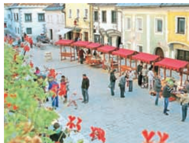
Na uvodnem dnevu v Okuse Radol'ce so se predstavili številni lokalni dobavitelji.