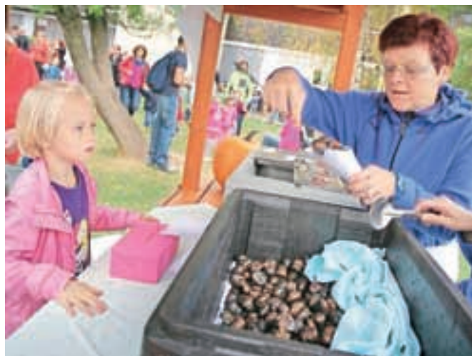
Kostanj so pekli tudi na igrišču radovljiškega vrtca.