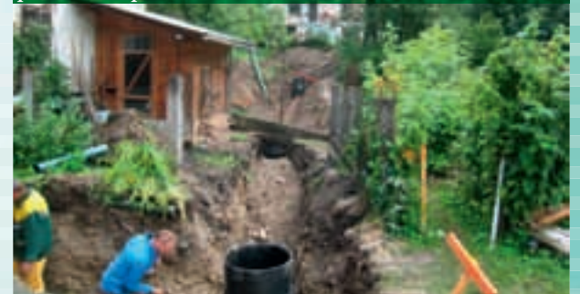
Izgradnja sekundarnega kanala v naselju Begunj poteka tudi po vrtovih

sestavlja več podprojektov – še izgradnja kanalizacije v občini Žirovnica, izgradnja kanalizacije in nadgradnja ter rekonstrukcija centralne čistilne naprave v občini Jesenice in izgradnja kanalizacije ter centralne čistilne naprave v občini Bohinj, pa bo zaključen do decembra 2015.