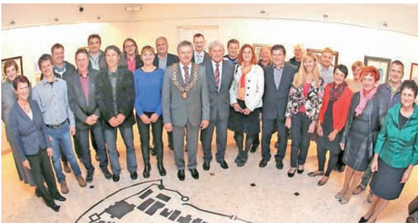
Novi občinski svet Občine Radovljica se je 22. oktobra sestel na svoji prvi, ustanovni seji.