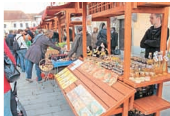
Predstavitev Okusov je na Linhartov trg privabila kar lepo število obiskovalcev.