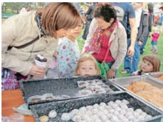
Otroci so se sladkali s presnimi sladicami.