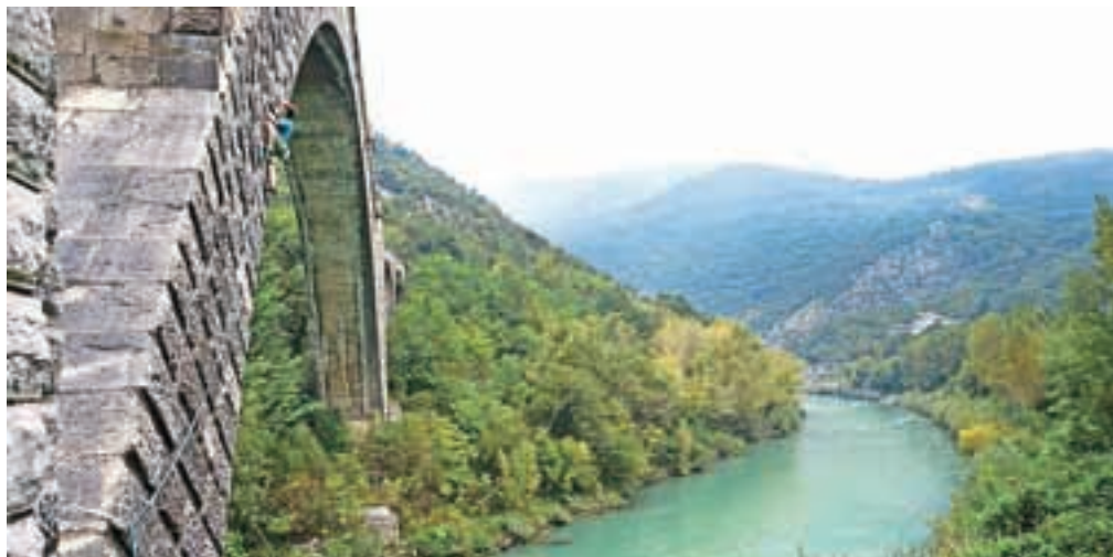
Domen Škofic na solkanskem mostu

Gre za prvi t. i. urbani plezalni cilj študenta Fakultete za šport in plezalca iz AO Radovljica. Solkanski most, ki si ga je izbral, ima najdaljši kamniti lok na svetu, dolg kar 85 metrov, nad gladino Soče pa se dviga skoraj štirideset metrov. Domen se je plezanja po kamnitih blokih lotil z levega brega, po šestdesetih metrih pa ga je zaključil na najvišji točki loka. Za plezanje je porabil manj kot pol ure, vzpon pa ocenil z oceno 7c. Kot je priznal po plezanju, ga je podvig povsem navdušil, saj ga je ocenil kot nekaj najboljšega, kar lahko doživiš. A časa za proslavljanje dosežka ni