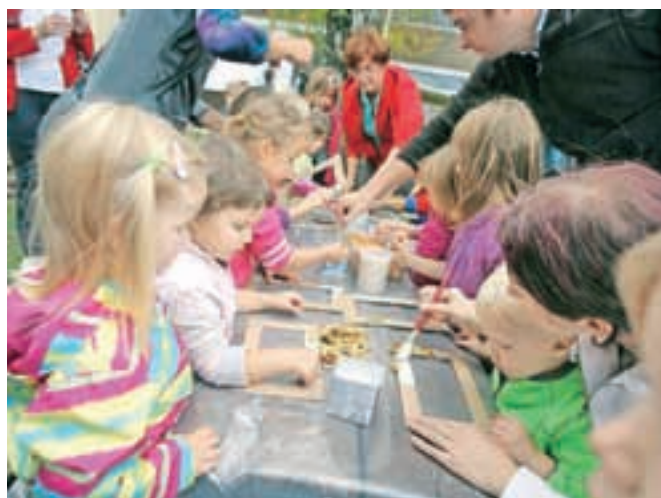
V delavnicah so izdelovali izdelke iz jesenskih plodov.