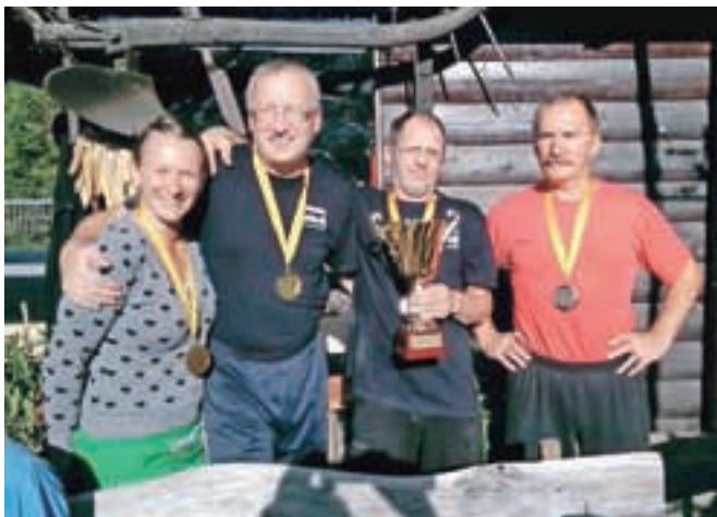
Zmagovalna ekipa Balinišča Kokelj