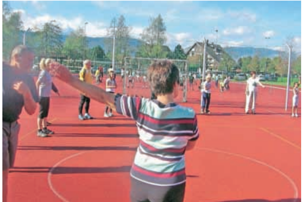
Utrinki z vadbe za dedke in babice na igrišču pred leško šolo