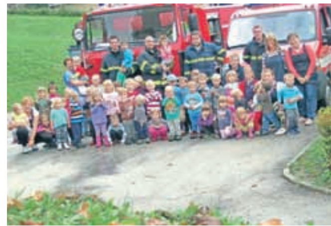
Otroci so bili posebej navdušeni nad vajo, ki so jo v vrtcu izvedli domači gasilci. Z vajo so obeležili mesec požarne varnosti.

dli evakuacijsko vajo. "Zaslišali smo znak za požar, hitro smo se morali zbrati pri zbirnem mestu na igrišču vrtca. V stavbi je ostala le naša gospodinja. Gasilci so jo poškodovano prinesli na nosilih iz stavbe. Otroci so se živili v akcijo, a se je vse dobro končalo. Z gasilsko cevjo in močnim vodnim curkom so gasilci rešili žogo, ki je bila že dolgo časa ujeta visoko na drevesu. Tudi otroci so poskusili upravljati vodno cev. Pokazali so nam gašenje s peno in razkazali kamion z opremo. Zares razburljivo! Z obiskom gasilcev smo obeležili mesec požarne varnosti."